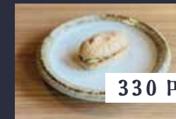
珈琲とナッツの ダックワーズ