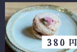
桜あんバターサンド