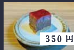
フランボワーズと ミルクチョコのムース