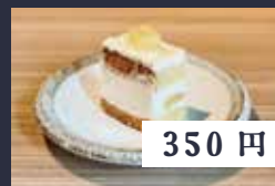
パイナップルの ケーキ