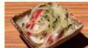
タコと玉ねぎの 大葉の自家製ジェノベーゼマリネ