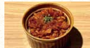
ミートソースとマッシュポテト ～自家製ハーブチーズ～