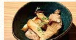
鶏肉とエリンギの アンチョビソース焼き