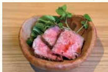
国産和牛の自家製ローストビーフ