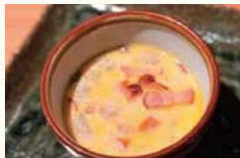
豆乳のホワイトミネストローネ