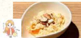
こぼれ梅のクリームチーズ ～さつま芋とあんぽ柿～